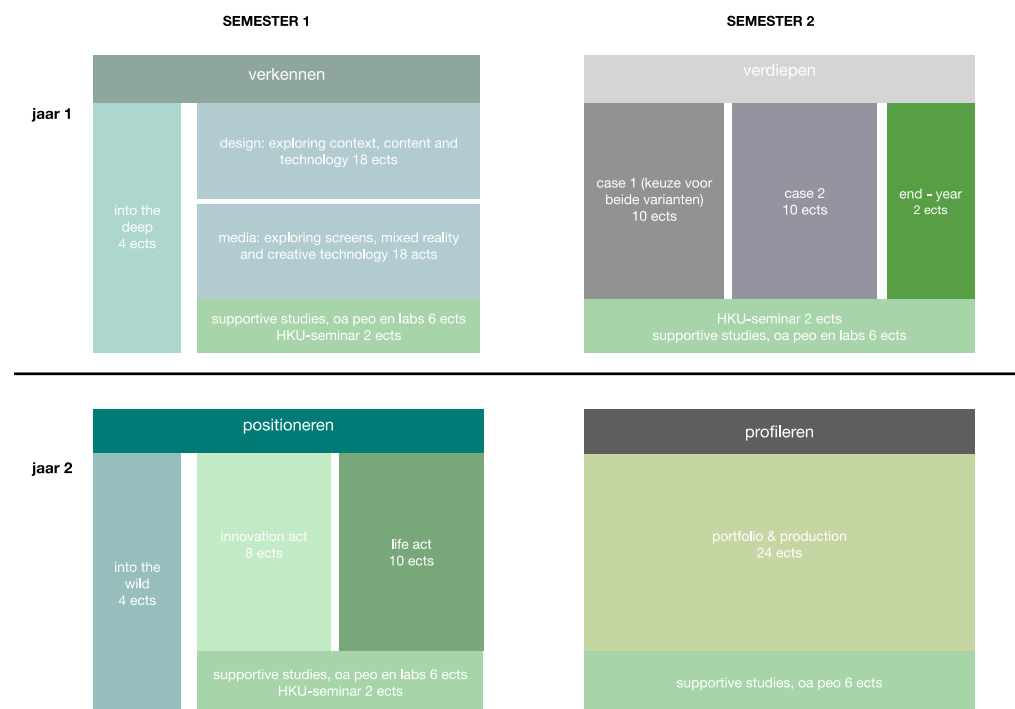
tabel 1: overzicht opbouw curriculum

Beide studie jaren starten met een kick-off: 'Into the deep' in jaar 1 en 'Into the wild' in jaar 2. Hierin worden de studenten in jaar 1 via een 'vrij in te steken' opdracht in het diepe gegooid (Digital Media) of maken zij kennis met 'het maken' via workshops en bezoek aan werkplaatsen (Connected Design). Studenten moeten aan het einde van dit eerste blok een i-product (Digital Media) of een ruimtelijk magazine (Connected Design) opleveren. Jaar 2 start weer met een kickoff, maar dan met een focus op verkennen van de eigen interesse en hoe je hierop kunt voortbouwen (Digital Media) of het in een sneltreinvaart doorlopen van een ontwerpproces (Connected Design). Het auditteam is zeer gecharmeerd van de ideeën rondom en de invulling van deze opstartmomenten in ieder studiejaar. Het vormt een mooie basis voor het creëren van onafhankelijke, agnostische denkers.